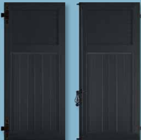
Volet alu - cadre épaisseur 30 mm 1/3 lames chevrons non ajourées - 2/3 lames verticales Finition sablé spécial - ferrage noir