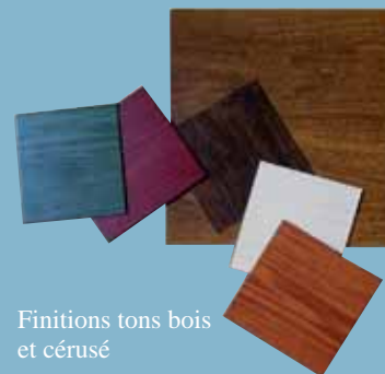
Finitions tons bois et cérusé