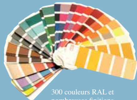
300 couleurs RAL et nombreuses finitions