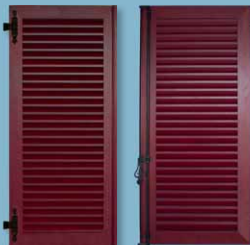
Volet alu - cadre épaisseur 30 mm Lames ajourées à la française Finition cérusée - ferrage noir