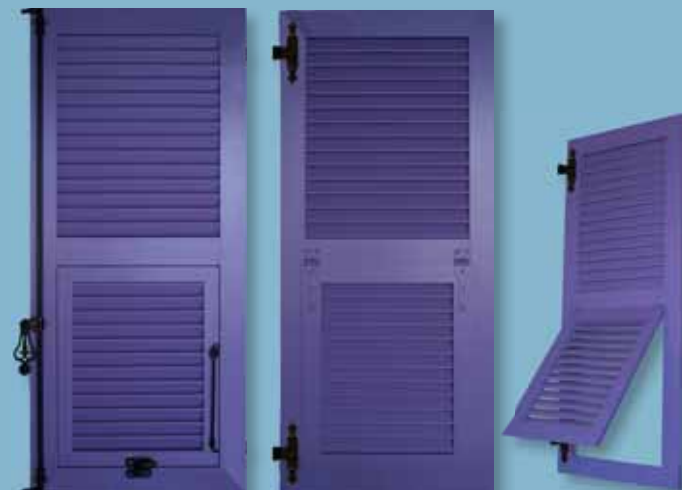
Volet alu - cadre épaisseur 30 mm Lames ajourées à projection "PORTISOL" Finition satinée lisse - Ferrage noir