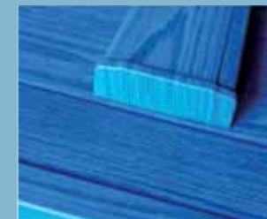
Détail de la barre