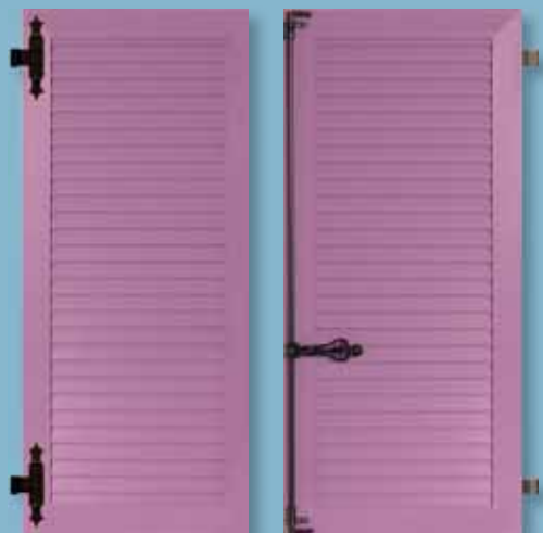
Volet alu - cadre épaisseur 30 mm Lames chevrons non ajourées Finition satinée lisse - ferrage noir