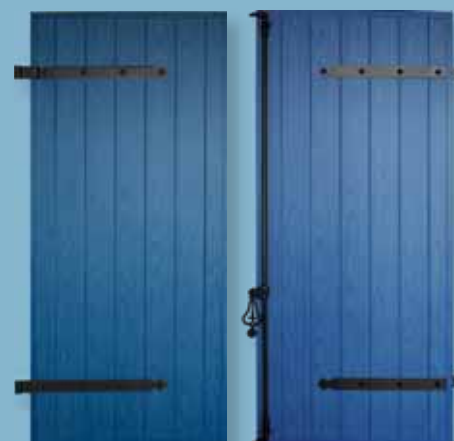
Volet alu isolé - épaisseur 27 mm Panneau à grain d'orge - pentures et contre-pentures Finition cérusée - ferrage noir