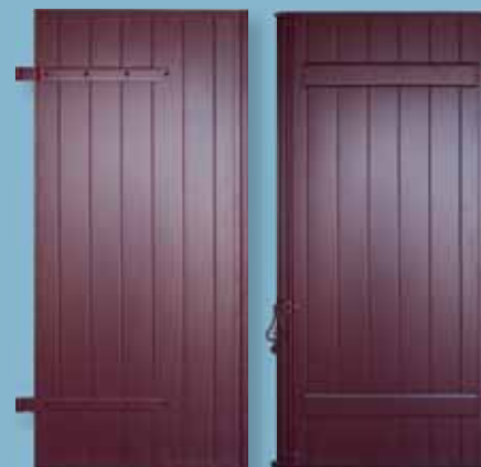
Volet alu isolé - épaisseur 27 mm Panneau à grain d'orge - barres seules Finition satinée lisse - ferrage laqué