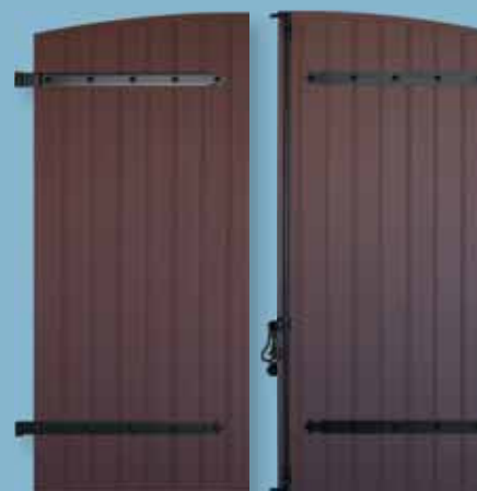
Volet alu extrudé - épaisseur 27 mm Lames à mouchette - pentures et contre-pentures Cintre surbaissé Finition sablé spécial - ferrage noir