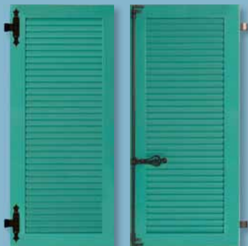
Volet alu - cadre épaisseur 30 mm Lames ajourées à l'américaine Finition satinée lisse - ferrage noir