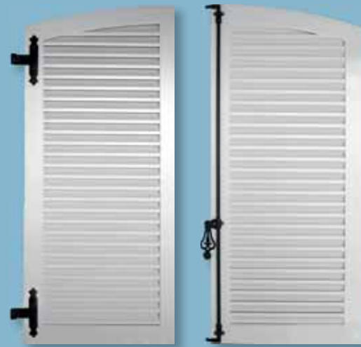
Volet alu - cadre épaisseur 30 mm Lames ajourées à la française - traverse haute cintrée Finition structuré mat fin - ferrage noir