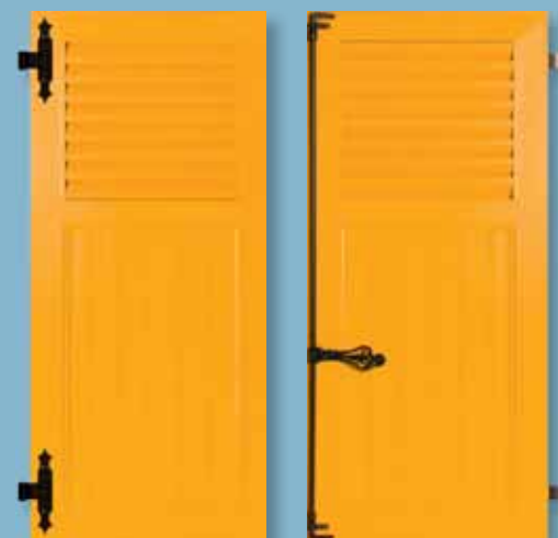
Volet alu - cadre épaisseur 30 mm 1/3 lames ajourées à la française - 2/3 lames verticales Finition satinée lisse - ferrage noir