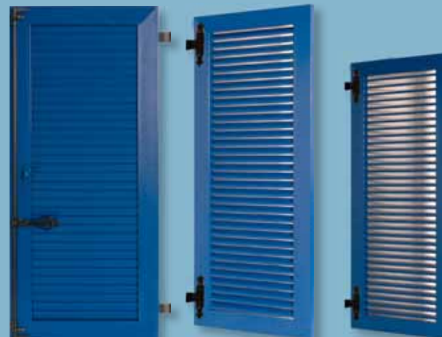
Volet alu - cadre épaisseur 30 mm Lames ajourées à l'américaine orientables Finition satinée lisse - Ferrage noir