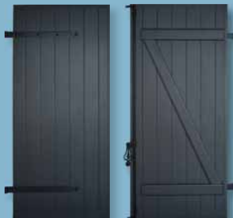
Volet alu isolé - épaisseur 27 mm Panneau à grain d'orge - barres et écharpe Finition sablé spécial - ferrage noir